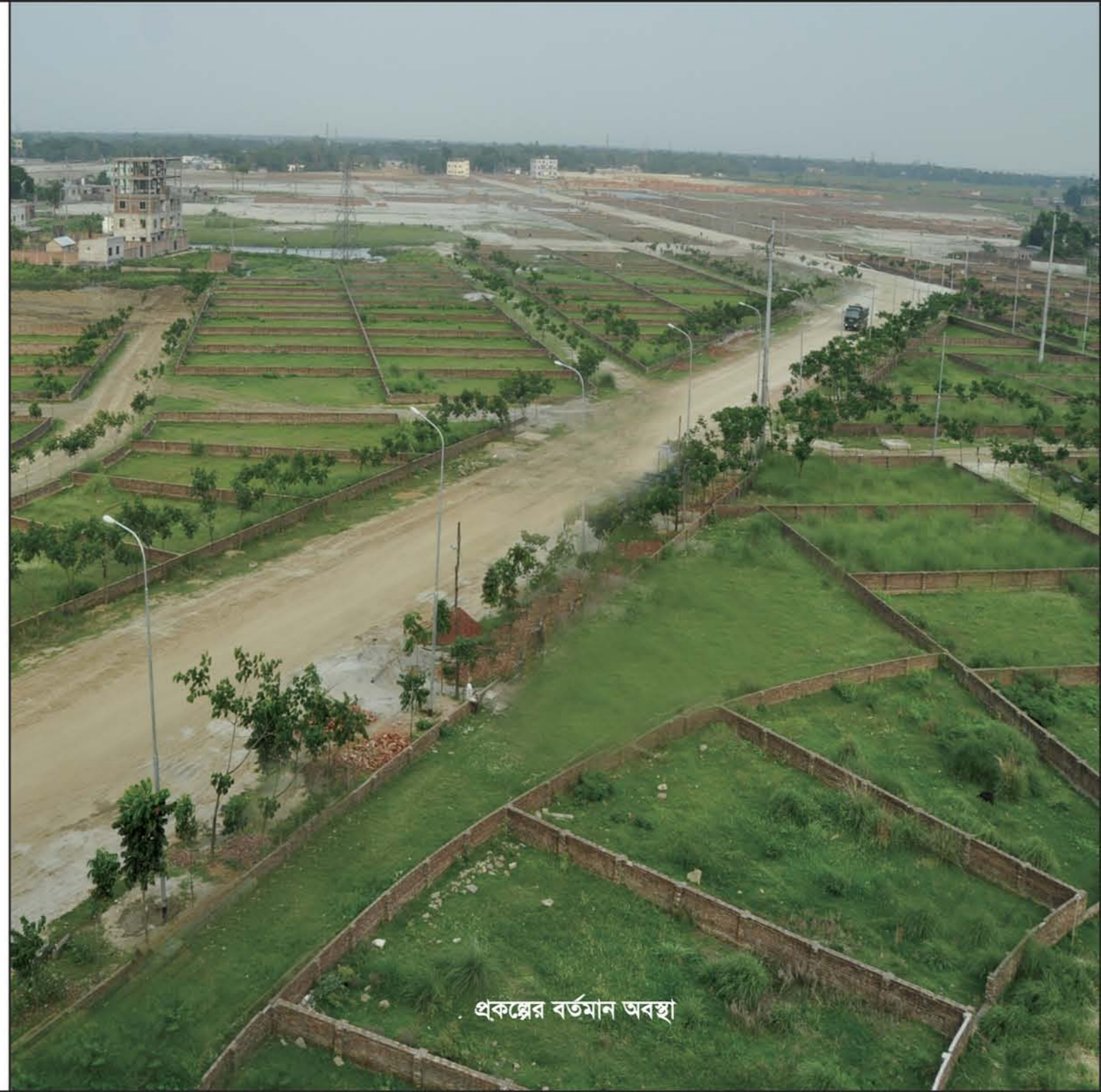
প্রকল্পের বর্তমান অবস্থা